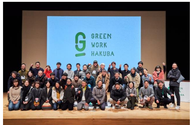
《2021年に参加したカンファレンスの様子》